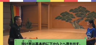
掛け声は基本的の下から上へ声を出す。 「よーい」は上(ファルセット・裏声)から下へ。