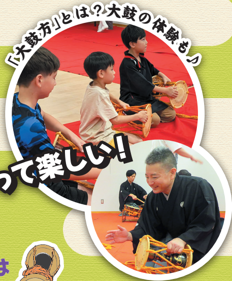
「大鼓方」とは？大鼓の体験も！