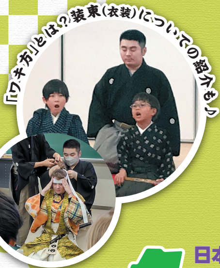
「ワキ方」とは？装束(衣装)についての紹介も！