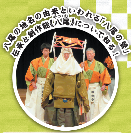
八尾の地名の由来といわれる「八尾の能」 伝承と創作能「八尾」について知る！