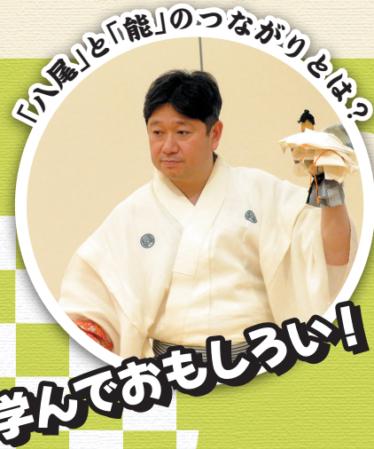
「八尾」と「能」のつながりとは？